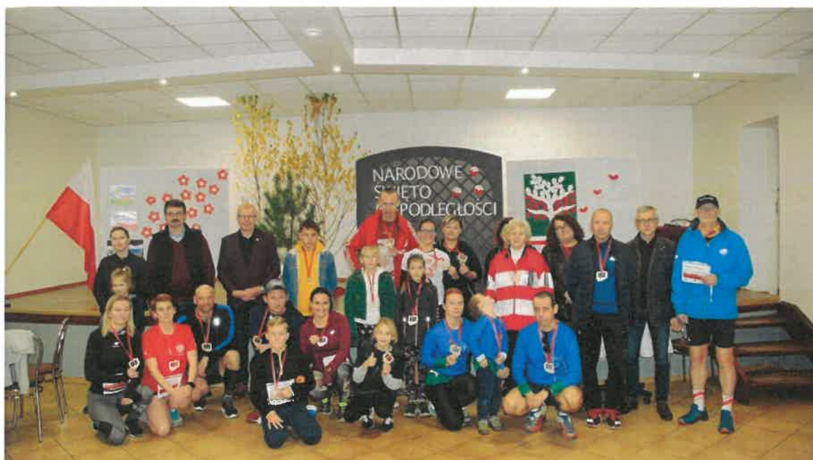
XII Bieg Niepodległości w Drzewianowie