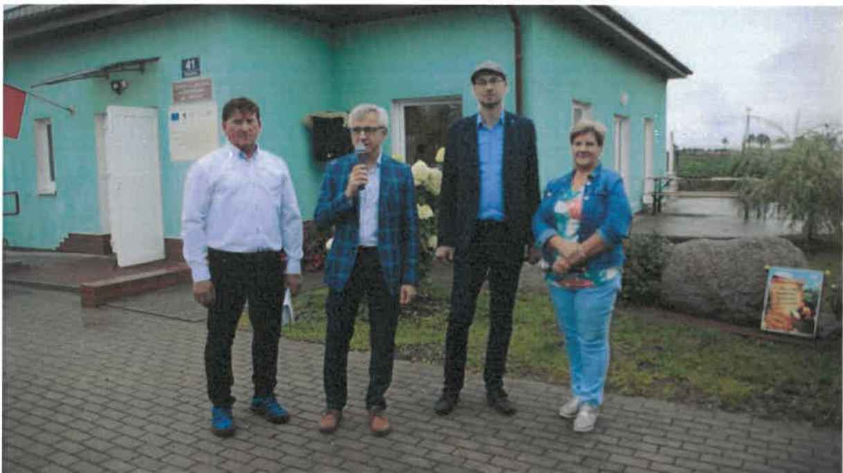
Święto Ziemniaka w Matyldzinie