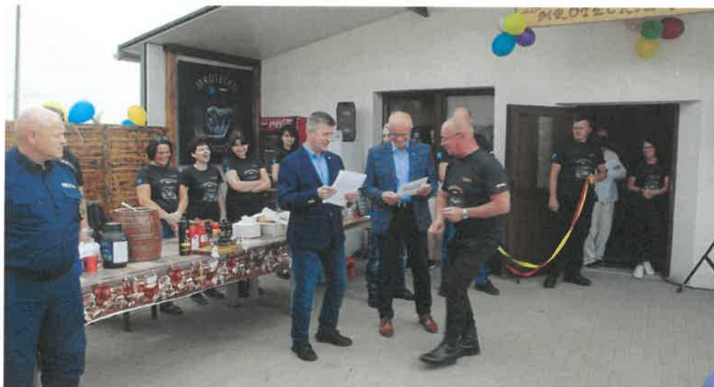
Otwarcie siedziby Klubu Motocyklowego „Mroteckie Anioły”