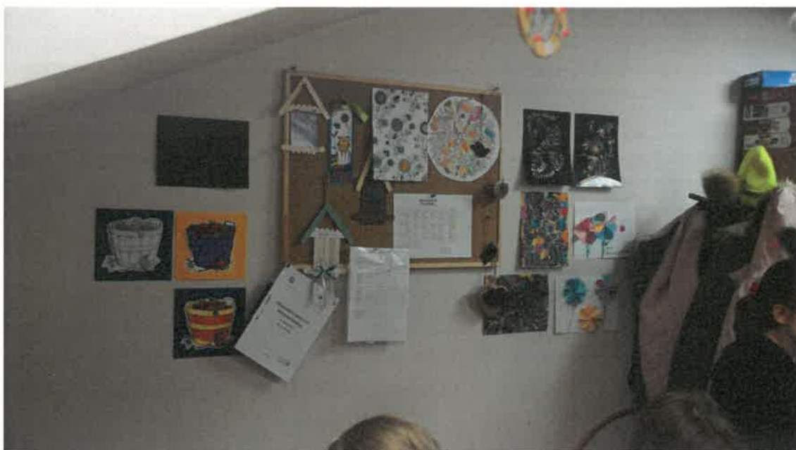
Tabela 1: Zestawienie wsparcia finansowego w ramach udzielonych dotacji