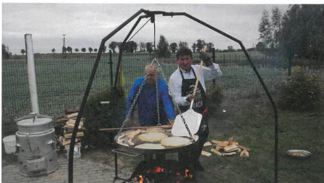
„Święto Ziemniaka” w Matyldzinie”