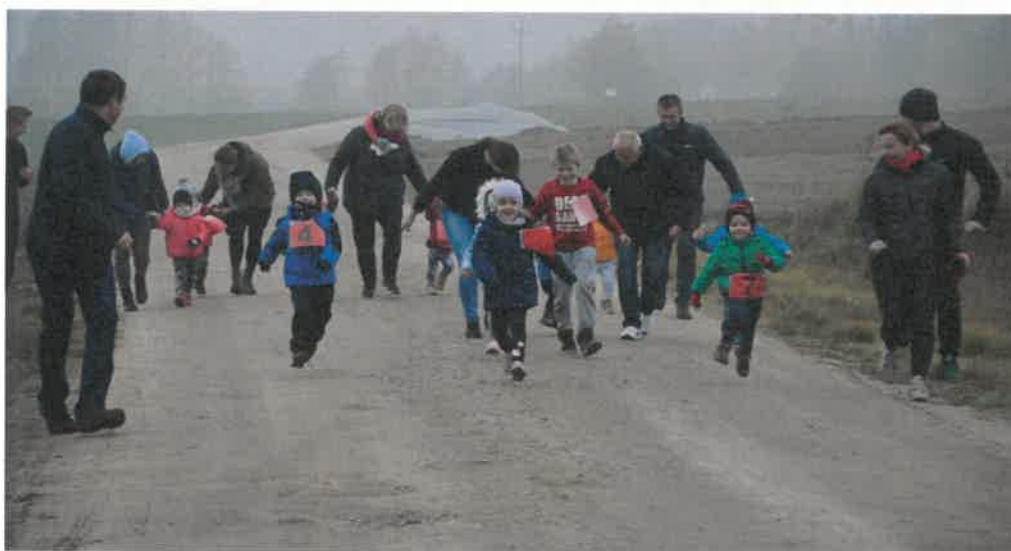
Bieg Niepodległości w Drzewianowie