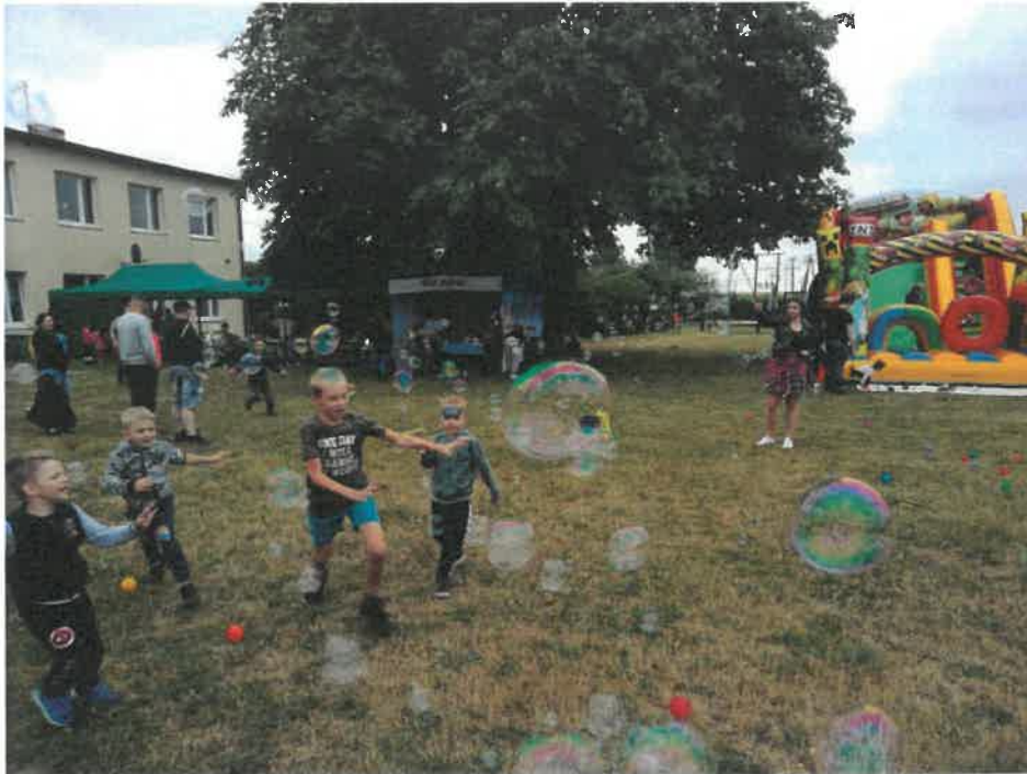
Festyn „Sołeckie smaczki” w Kosowie

Łączna wysokość środków finansowych przeznaczonych z budżetu Gminy Mrocza na współpracę finansową z organizacjami pozarządowymi w 2021 roku wyniosła 191 292,18 zł.